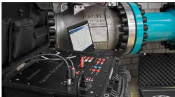
Система динамического тестирования (DPTS) компании «Моквелд»

Система диагностики клапанов позволяет компании «Моквелд» в тесном сотрудничестве с вашим персоналом определять стратегию технического обслуживания, направленную на предотвращение ненужных проверок оборудования. Кроме того, она обеспечивает расширенный цикл повторной сертификации безопасности и критического для производства оборудования.