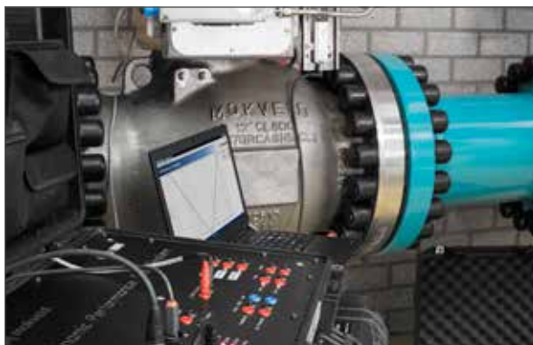
Dem dynamischen Leistungsprüfsystem (DPTS) von Mokveld

Mit dem Ventildiagnosesystem kann Mokveld in enger Zusammenarbeit mit Ihren Mitarbeitern eine vorausschauende Wartungsstrategie festlegen, die darauf abzielt, unnötige Inspektionen der Ausrüstung zu vermeiden. Darüber hinaus ermöglicht das System einen verlängerten Neuzertifizierungszyklus für kritische Sicherheits- und Produktionsausrüstung.